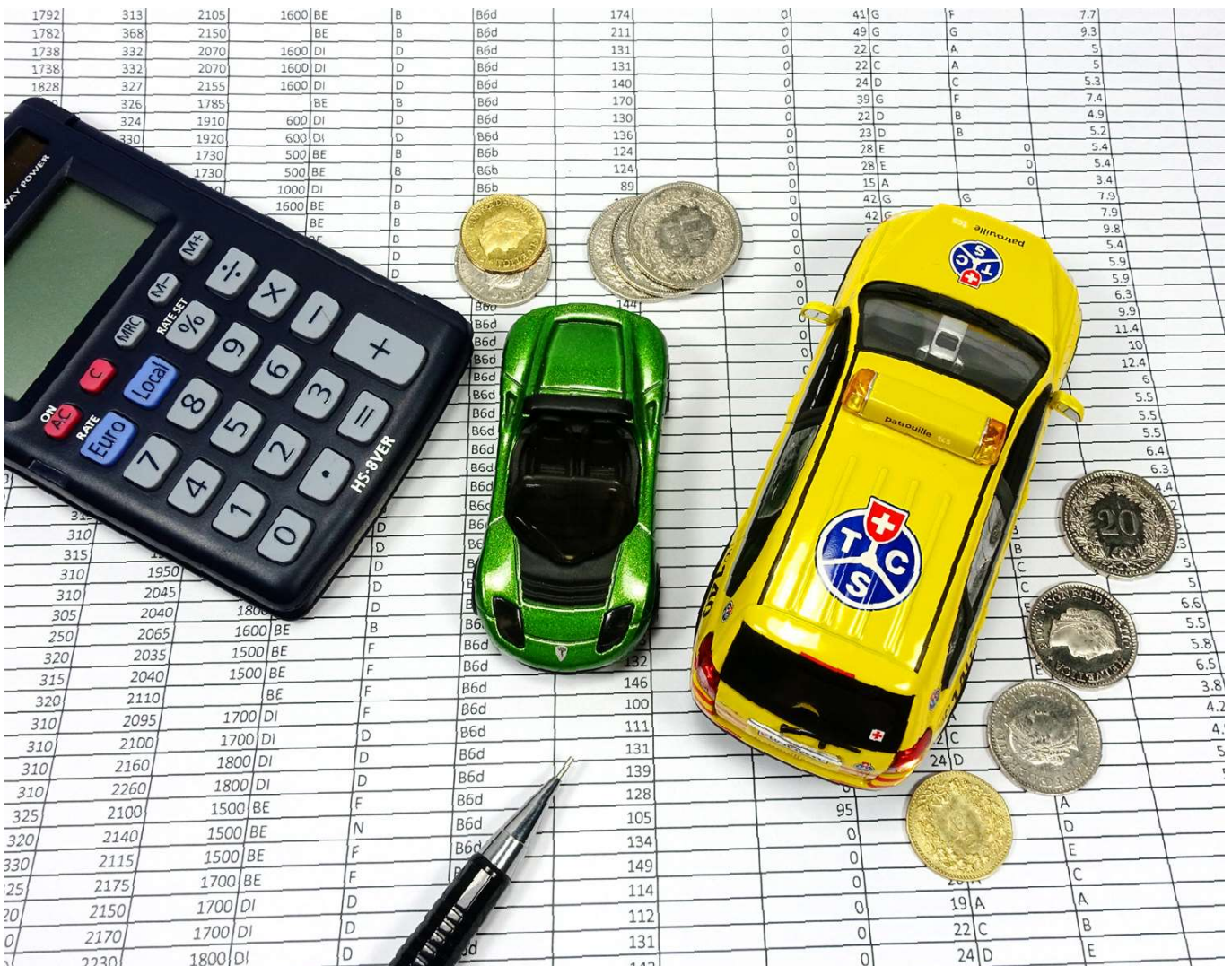
Le financement est un élément clé du processus décisionnel de l'achat d'une voiture.

Particuliers: dans la mesure du possible, payer sa voiture au comptant.